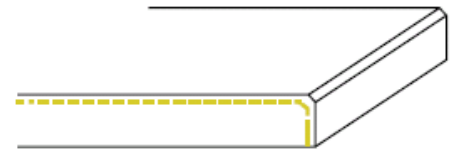
1F zijkant geslepen (enkel facet)