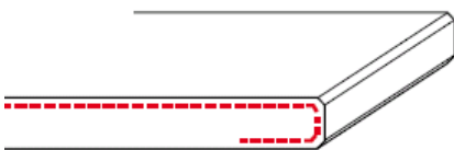
1/O zijkant afgewerkt + onderzijde 50mm gezoet (12mm) (2 x facet)

De randafwerkingen voor de 2K, 2F, 2T en 2/O zijn identiek aan de 1 serie echter uitgevoerd in 20mm