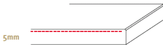
5mm Standaard afwerking (bovenzijde minimaal facet)