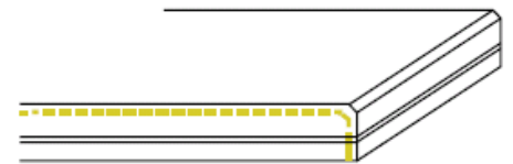
F7 / T7 zijkant gepolijst (enkel facet)