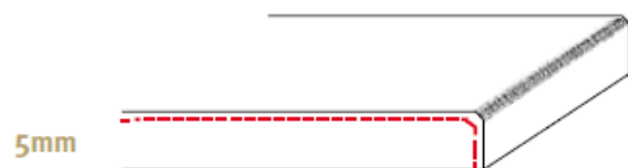
5mm P5 zijkant gepolijst (enkel 'geborsteld' facet)