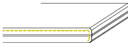
K7 zijkant gepolijst (2 x facet)