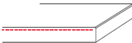
standaard afwerking (bovenzijde minimaal facet)