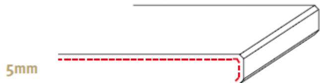
5mm K5 zijkant gepolijst (2 x facet)