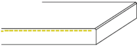
Standaard afwerking (bovenzijde minimaal facet)