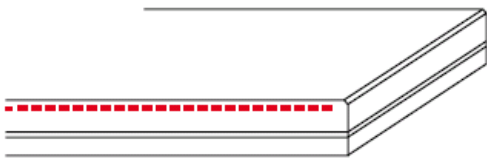
Standaard afwerking (bovenzijde minimaal facet)