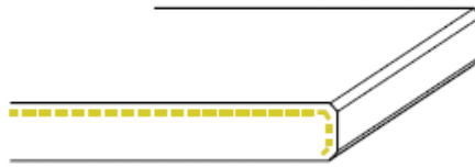
1K zijkant geslepen (2 x facet)