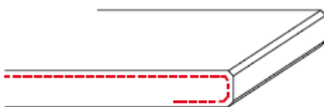
2/O zijkant afgewerkt + onderzijde 50mm gezoet (2 x facet)