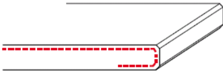
1/O zijkant afgewerkt + onderzijde 50mm gezoet (2 x facet)