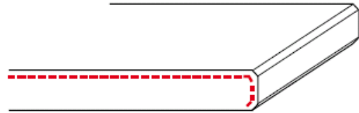
G6 (6mm) bovenzijde + voorzijde glans (2 x facet)