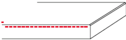
standaard afwerking (12mm) (bovenzijde minimaal facet)