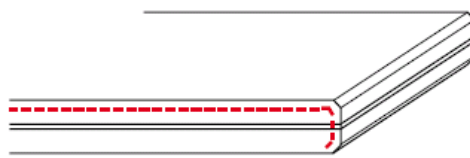
K7 zijkant gepolijst (2 x facet)