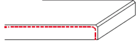
1F / 1T zijkant afgewerkt (enkel facet)