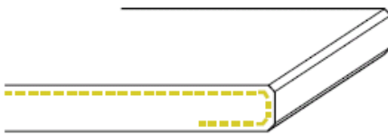
1/O zijkant afgewerkt + onderzijde 50mm gezoet (2 x facet)