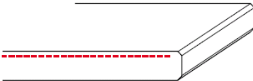
standaard afwerking bovenzijde Satinato (2 x facet)