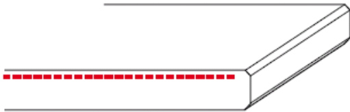
standaard afwerking bovenzijde glans (2 x facet)