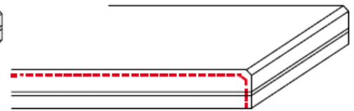
F7 / T7 zijkant gepolijst (enkel facet)